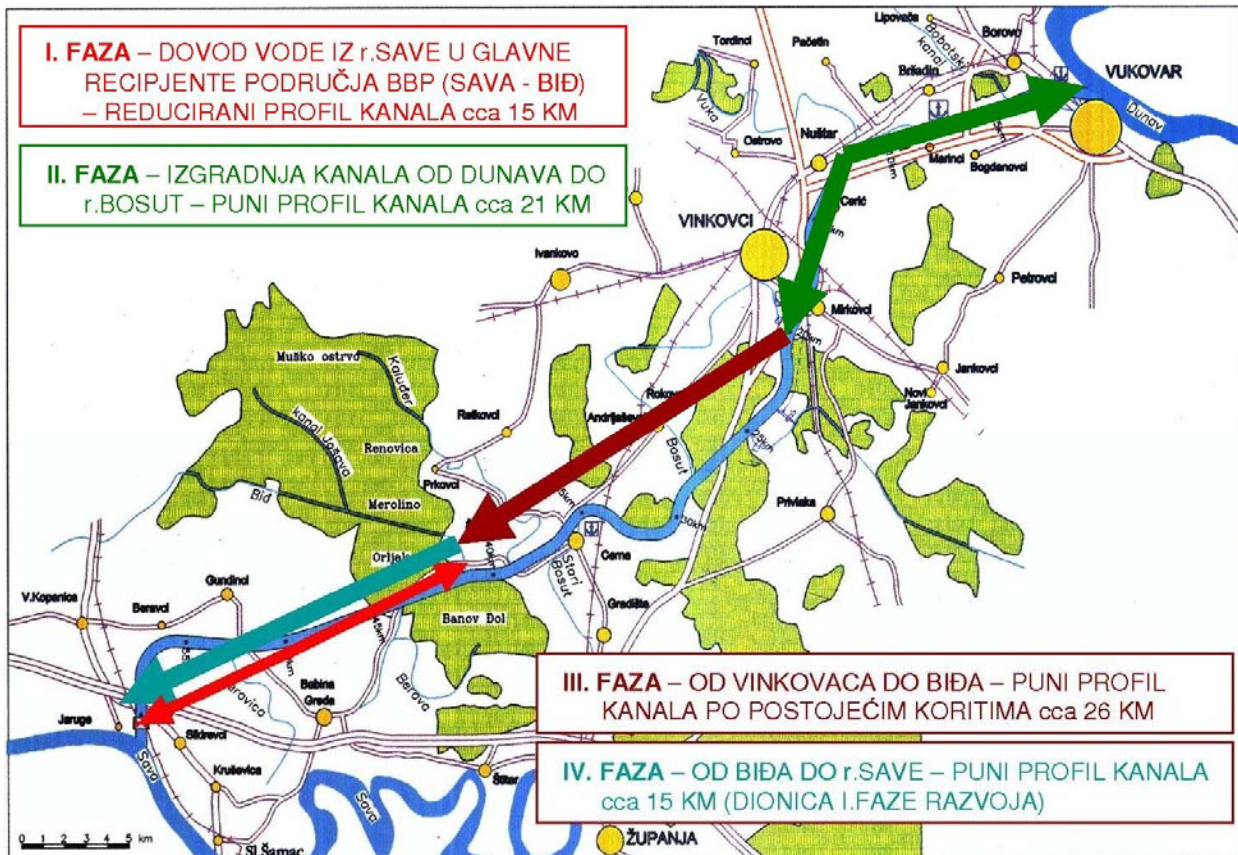
SI. Situacijski prikaz tehničkog rješenja faznog razvoja sustava VKDS

Ministarstvo zaštite okoliša, prostornog uređenja i graditeljstva - Zavod za prostorno planiranje i Zavod za prostorno planiranje d.d. Osijek